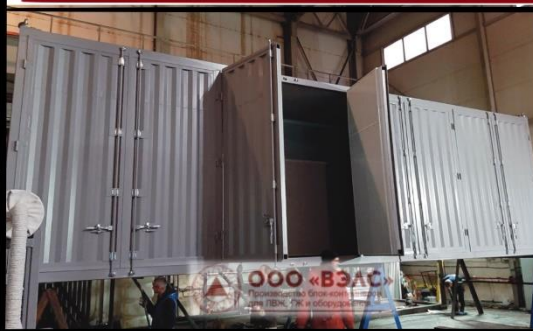
Блок-контейнер 12000x2450x3550 мм (ДхШхВ) для перевозки оборудования. Установлена ДГУ 30 кВт.