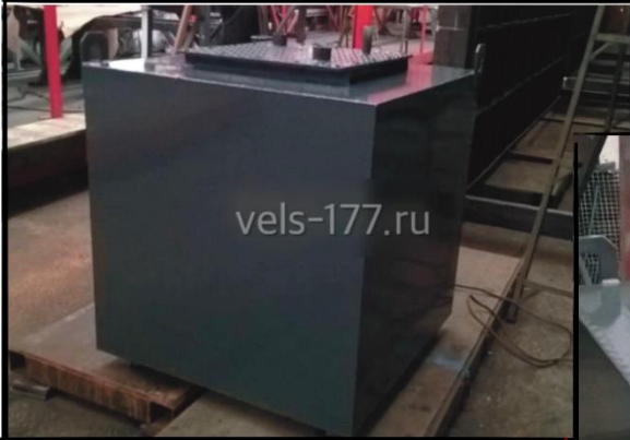
Металлическая емкость 1м2