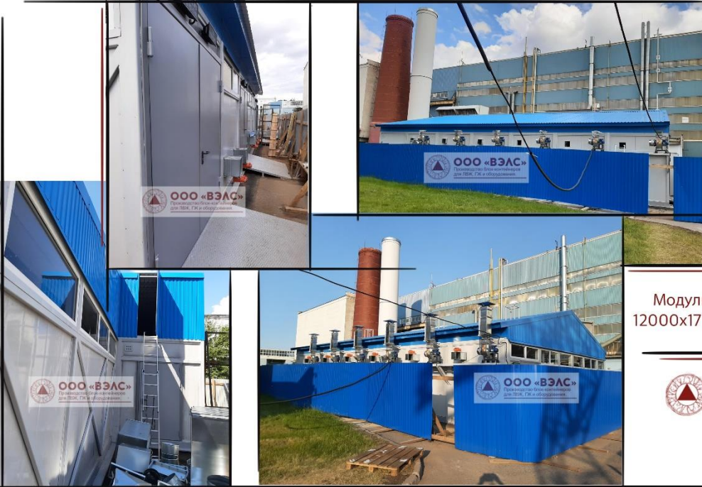
Модульный склад ЛВЖ, ГЖ 12000x17150x3000 мм (ДxШxВ)