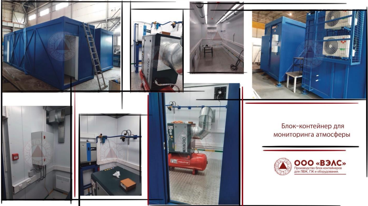
Блок-контейнер для мониторинга атмосферы