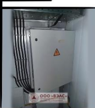
Блок-контейнер 5850x2400x3000 мм (ДхШхВ) для щитового оборудования