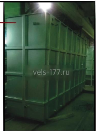
Металлическая емкость 15м2