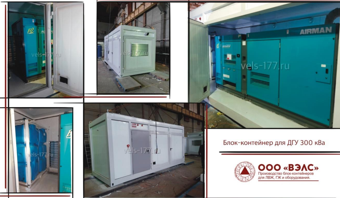
Блок-контейнер для ДГУ 300 кВа

ООО «ВЭЛС» Производство блок-контейнеров для ЛВЖ, ГЖ и оборудования.