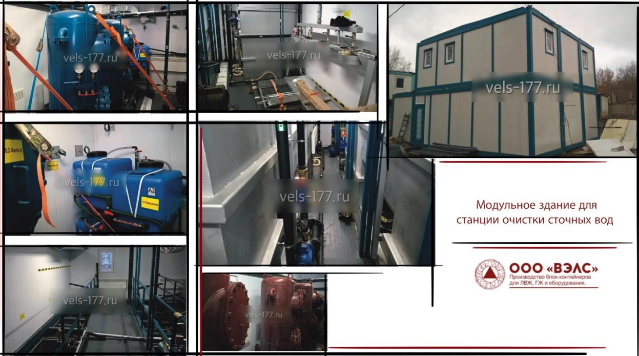
Модульное здание для станции очистки сточных вод